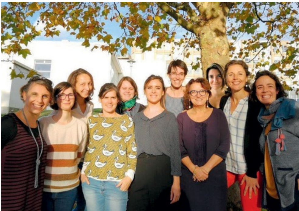
L'équipe des sages-femmes de La Bulle, filière physiologique