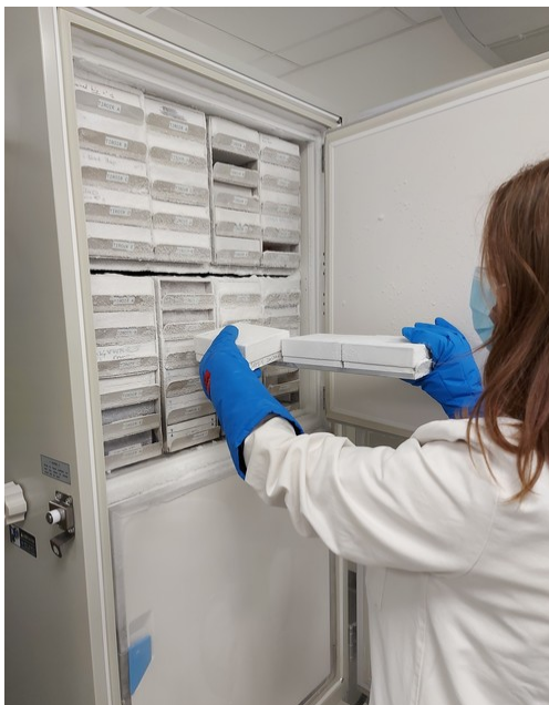
Déstockage d'échantillons à -80°C

Le centre de ressources biologiques - CRB Santé apporte son expertise et ses compétences pour la mise à disposition de ressources biologiques et données biocliniques de qualité