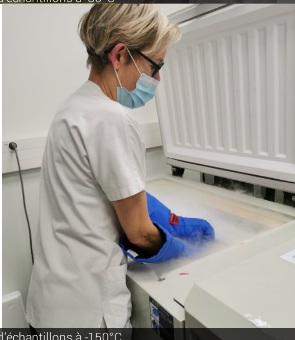
Déstockage d'échantillons à -150°C