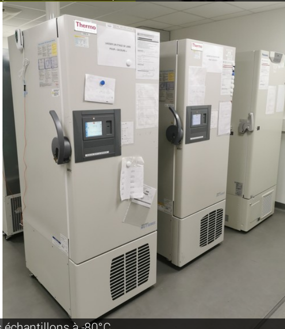
Stockage des échantillons à -80°C