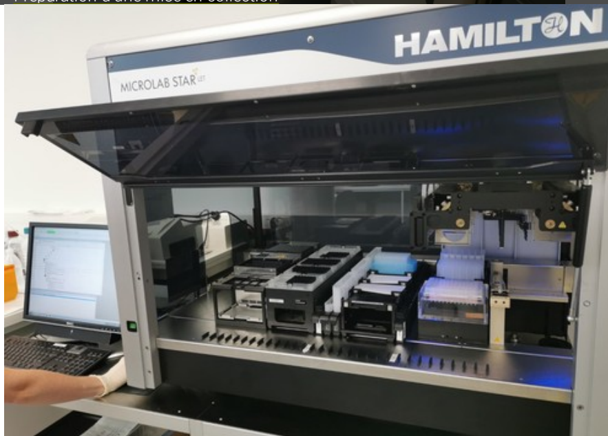
Préparation des produits dérivés sur Starlet-Hamilton