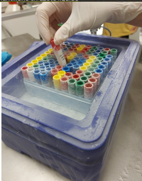
Préparation d'une mise à disposition d'échantillons biologiques