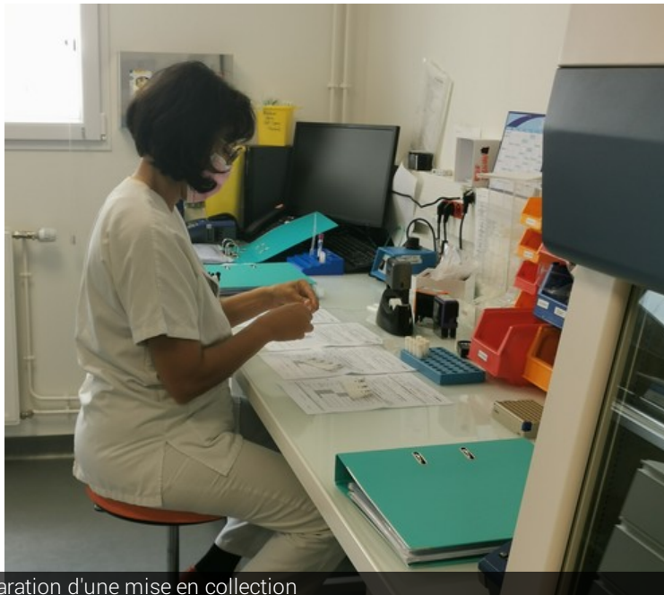
Préparation d'une mise en collection