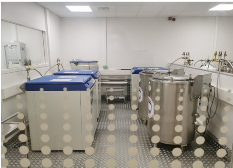
Stockage des échantillons en azote liquide