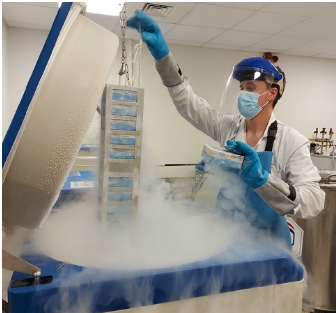
Déstockage d'échantillons en azote liquide