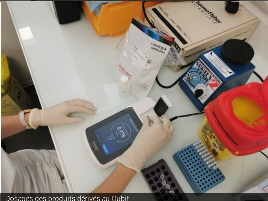
Dosages des produits dérivés au Qubit