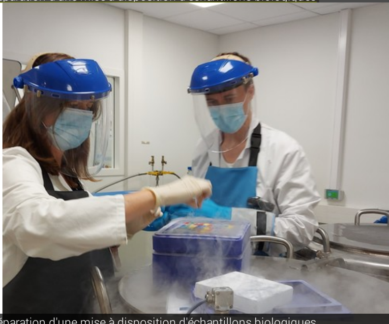
Préparation d'une mise à disposition d'échantillons biologiques