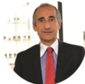
Pr Éric Bellissant, doyen de la faculté de médecine