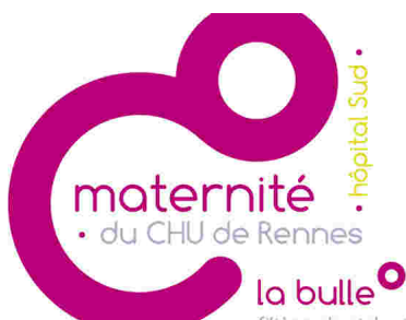
La Bulle, filière physiologique de la maternité