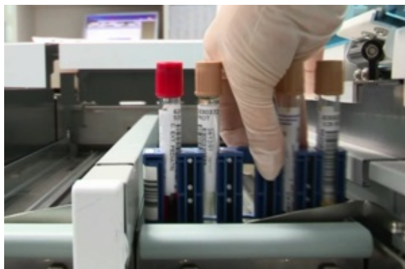
plateforme compte rendu rapide