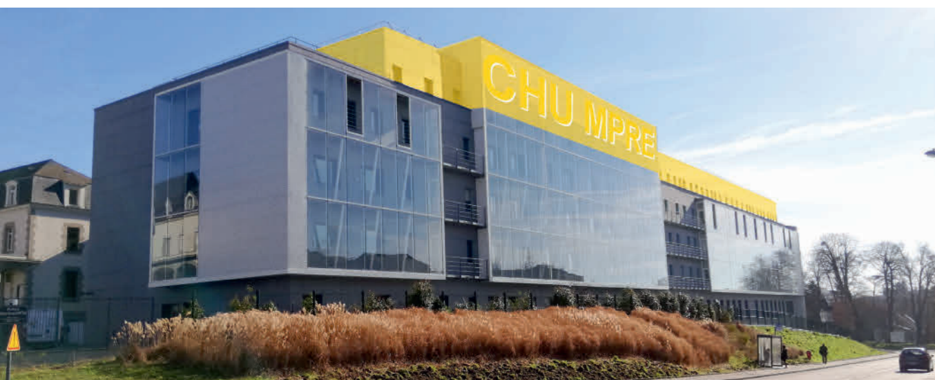
Implantation de l'unité MPRé dans la polyclinique Saint-Laurent

Votre enfant va être pris en charge dans l'unité de médecine physique et réadaptation pour enfant sur le site de Saint-Laurent (MPRe Saint-Laurent).