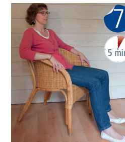
Restez assis ou allongé 5 autres minutes.