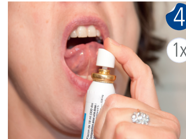
Ouvrir la bouche, lever la langue et placer le spray juste devant. Appuyer UNE FOIS pour pulvériser le médicament sous la langue. Fermer la bouche et attendre quelques secondes avant d'avaler.