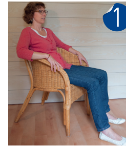
S'asseoir ou s'allonger.