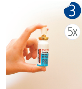
Amorcer le flacon en appuyant 5 fois sur le pulvérisateur.