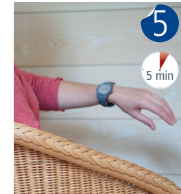
Regarder l'heure, rester assis. Au bout de 5 minutes la douleur doit avoir disparu.