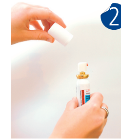
Décapuchonner le flacon.