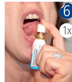
Si la douleur persiste prendre une autre pulvérisation.