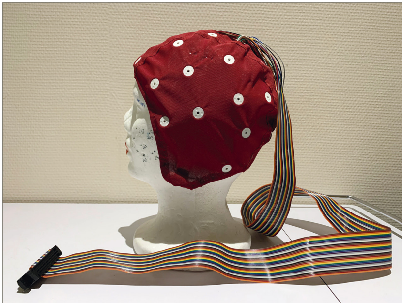
Figure 3. Exemple d'un casque d'enregistrement EEG.